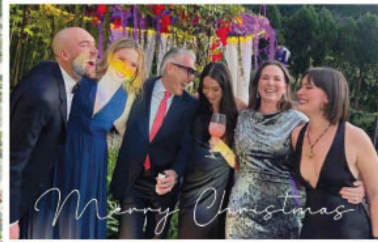
FELIZ NAVIDAD 2024

¡Felicidades de parte mía y de mi maravillosa familia!