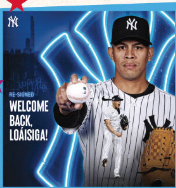
New York, NEW YORK

Feliz Navidad a todos! Muchas Bendiciones y lo mejor para 2025!