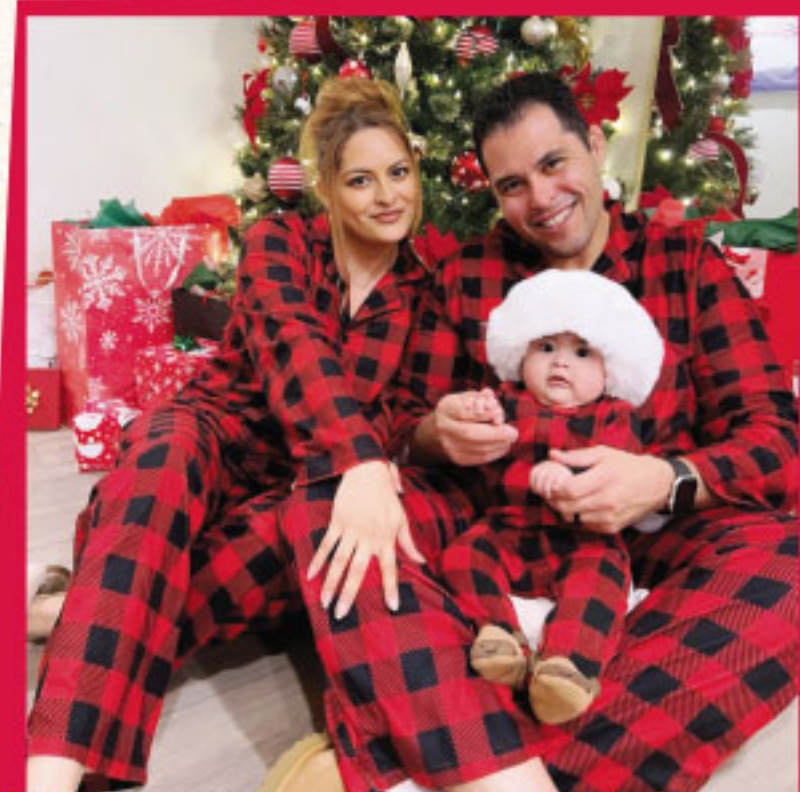
San Diego, CALIFORNIA

New York Yankees Welcome back, Loáisiga The New York Yankees announced that they have re- signed RHP Jonathan Loáisiga to a one-year Major League contract for the 2025 season with a club option for the 2026 season.