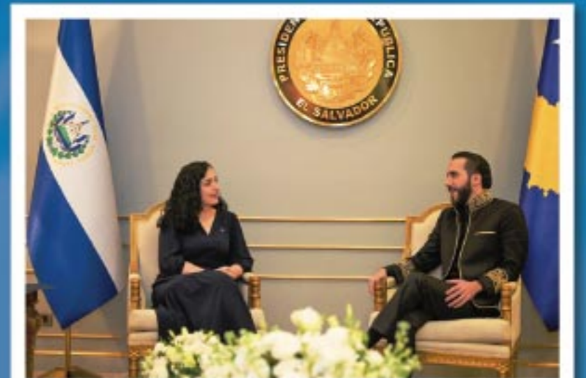
Vjosa Osmani @VjosaOsmaniPRKS President of the Republic of Kosova