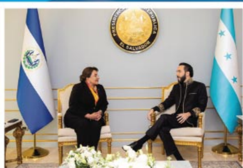
Xiomara Castro de Zelaya @XiomaraCastroZ Presidenta de la República de Honduras