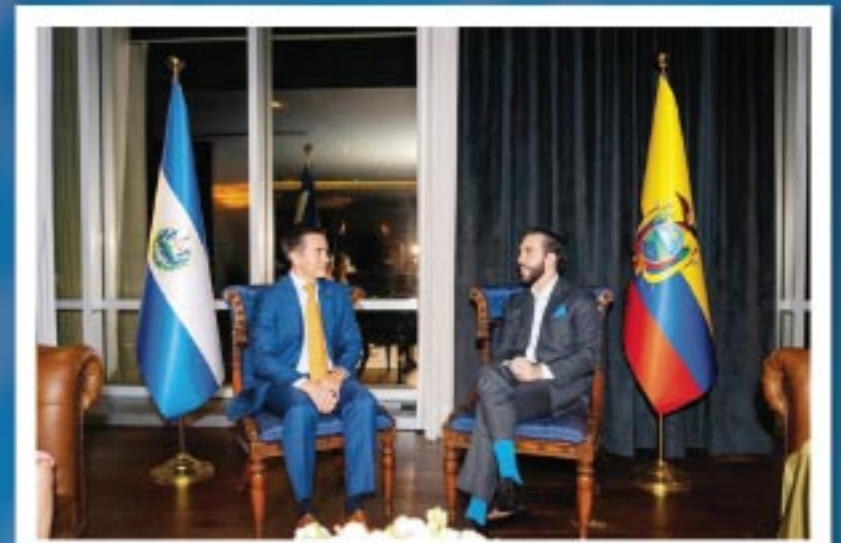
Daniel Noboa Azin @DanielNoboaOk Presidente de la República del Ecuador