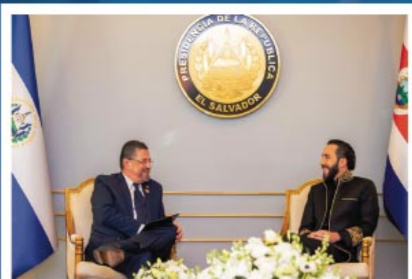
Rodrigo Chaves @RodrigoChavesR Presidente de la Republica de Costa Rica