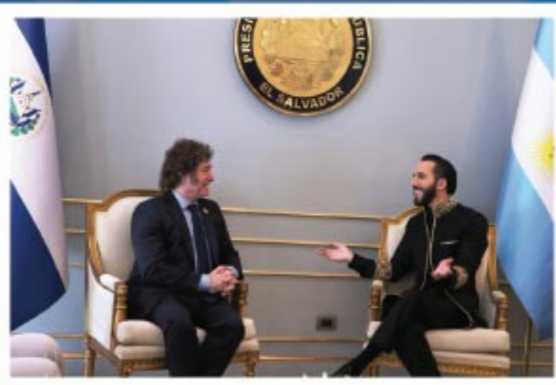
Javier Milei @JMilei Presidente de la Nación Argentina