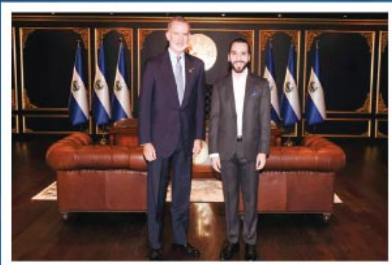
Rey Felipe VI - Rey de España @ElRey_FelipeVI Casa de S.M. el Rey @CasaReal