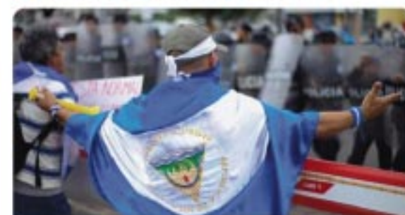
Nicaragua sigue siendo un polvorín

Nicaragua no se ha tranquilizado. Sigue la represión y hay un clima de tensión que subyace tras las trincheras del descontento y la esperanza en un futuro más digno. La Iglesia católica sigue su ruta solidaria con el pueblo nicaragüense. es.aleteia.org/2019/11/05/nic... via @AleteiaES