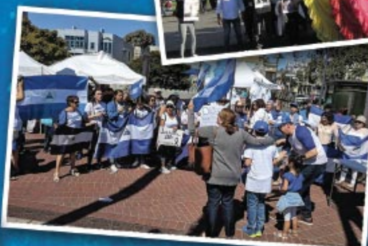
San Francisco California